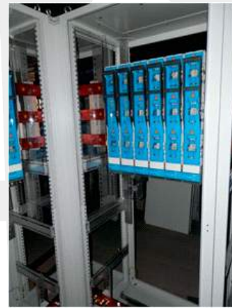
Vývodové polia z hlavného roz. RH 2500A pre drevovýrobu.