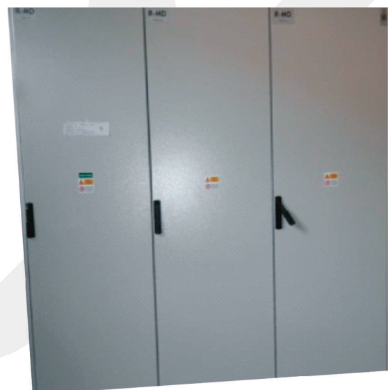
Polopriame meranie 250/5A s 250A istením a vývodovými pre napájanie technológie haly.