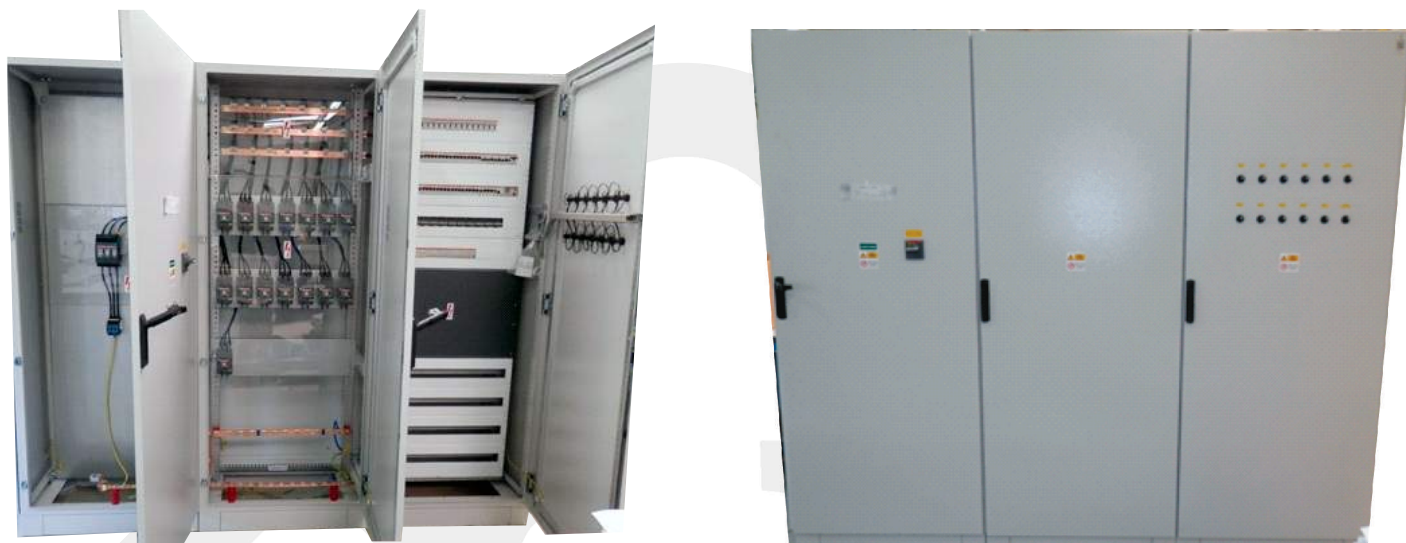
HI. roz. RH 250A istením a vývodovými pre napájanie technológie haly a ovládanie osvetlenie.