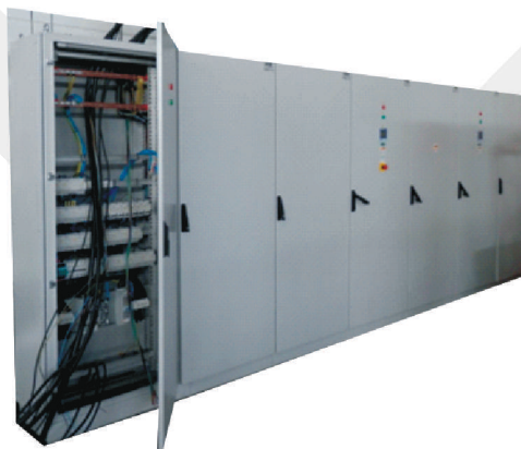
Hlavný roz. HR 2x1000A pre paralelnú prevádzku dvoch transformátorov súčasne.