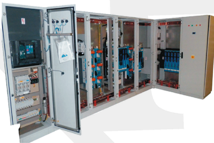
Hlavný roz. HR 2x2500A pre paralelnú prevádzku z dvoch strán