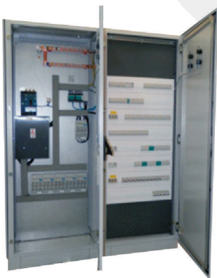
Podružný roz. HR1 s 250A istením a vývodmi pre prevádzku haly.